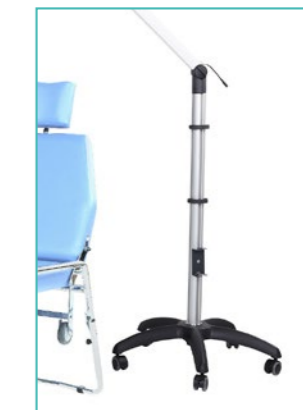
SUN-LED Anbindung an optionales Stativ