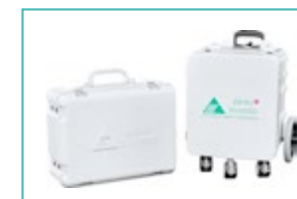
Bei Hindernissen oder zum Verstauen wird die Einheit abgedeckt.