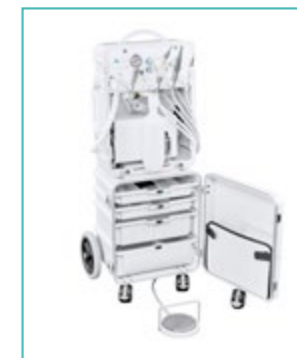
4 Schubladen für Instrumente / Verbrauchsmaterial Trennung rote und grüne Zone