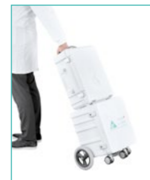
Auf einem Trolley Transport von Einheit / Instrumente / Verbrauchsmaterial