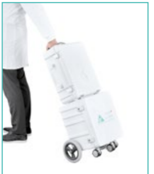
Transport de l'unité/instruments/consommables sur un trolley