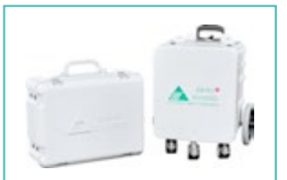
Roulable et portable: L'unité peut être désaccouplée en cas d'obstacles ou pour la ranger.