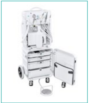
4 tiroirs pour instruments / consommables ; Séparation de la zone rouge et verte